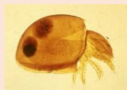
※写真はヒメハソイレコダニ

協力:埼玉県立川の博物館・日本ペドロロジー学会・(一社)日本土壌肥料学会・日本土壌動物学会