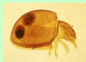
※写真はヒメヘソイレコダニ